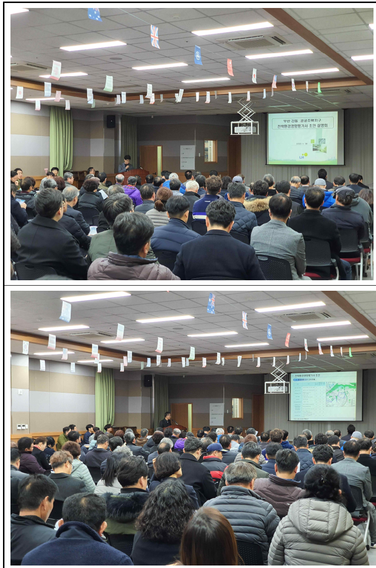
< 주민설명회 개최전경 >