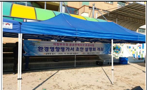
② 버들개초등학교(주민설명회 장소)