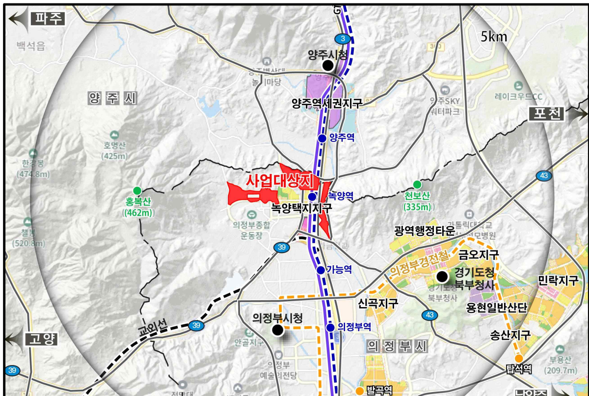
(그림 1-1) 사업지구 위치도