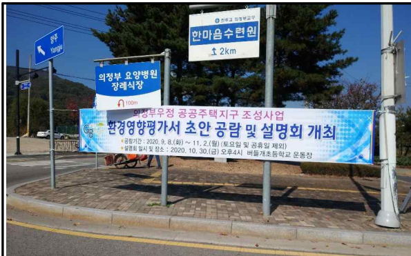
① 빙상장앞 회전교차로 인근