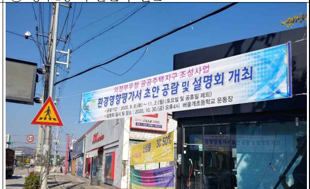
⑧ 패션아웃렛 입구 인근