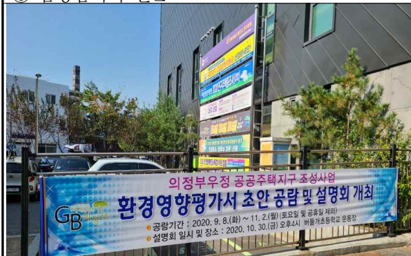
⑦ 흥선동 행정복지센터 인근