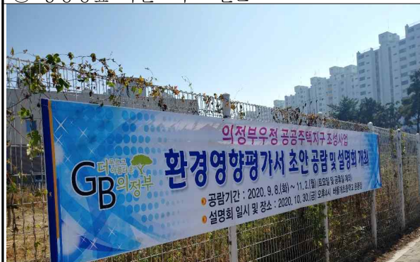
③ 현대자동차 사거리 인근