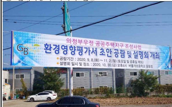
⑤ 남방삼거리 인근