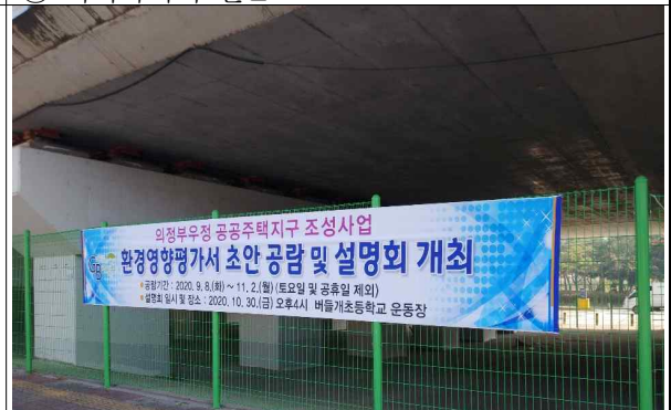
⑥ 양주1동 주민센터 인근