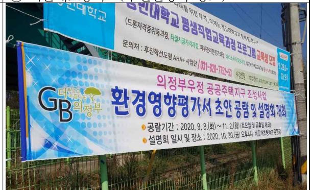
④ 비석사거리 인근