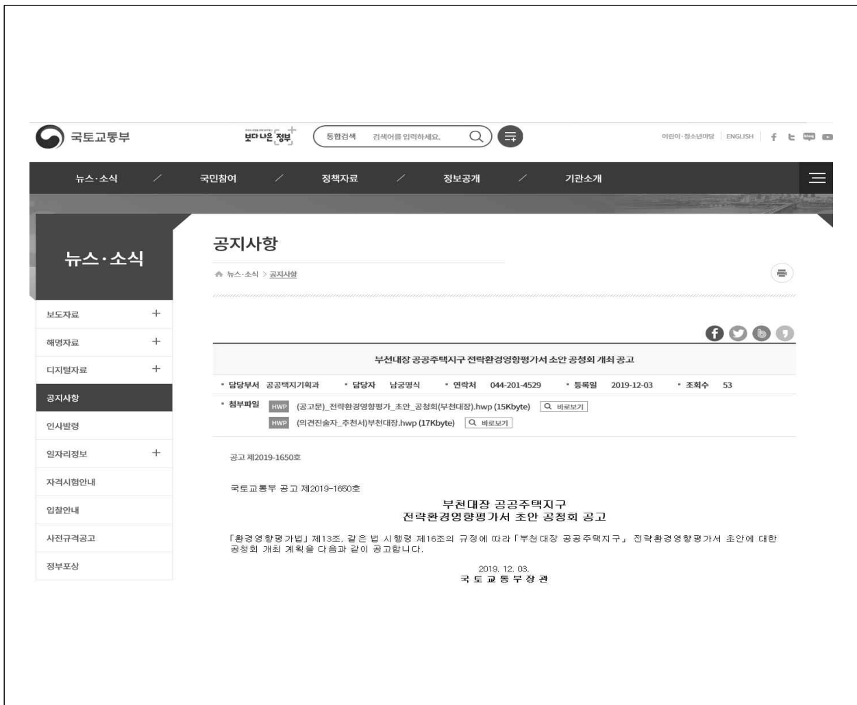
(그림 6) 국토교통부 홈페이지(http://www.molit.go.kr) 게재