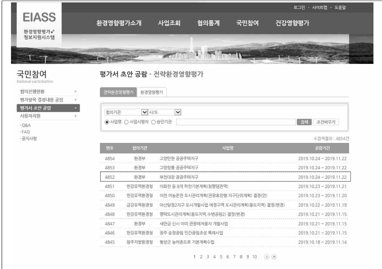
(그림 4) 환경영향평가정보지원시스템(https://eiass.go.kr) 게재