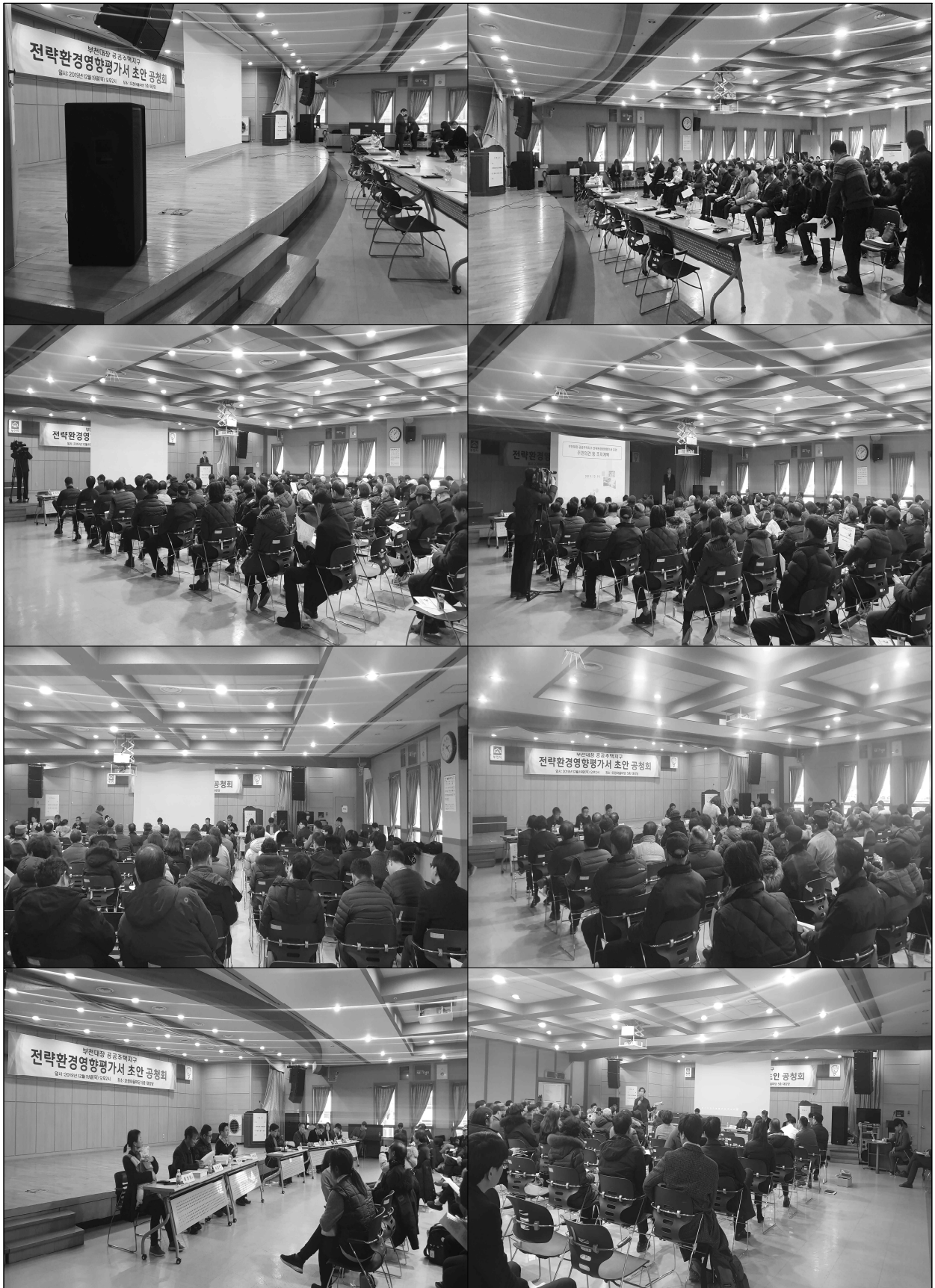
(그림 10) 공청회 전경