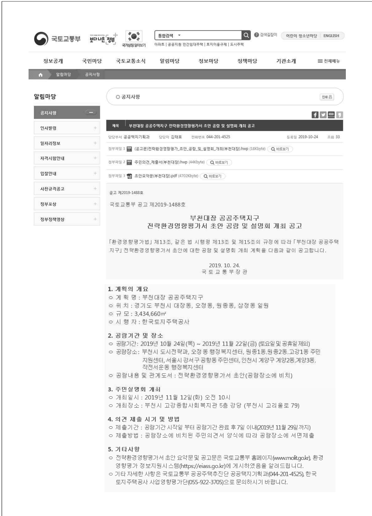
(그림 3) 국토교통부 홈페이지( http://www.molit.go.kr ) 게재