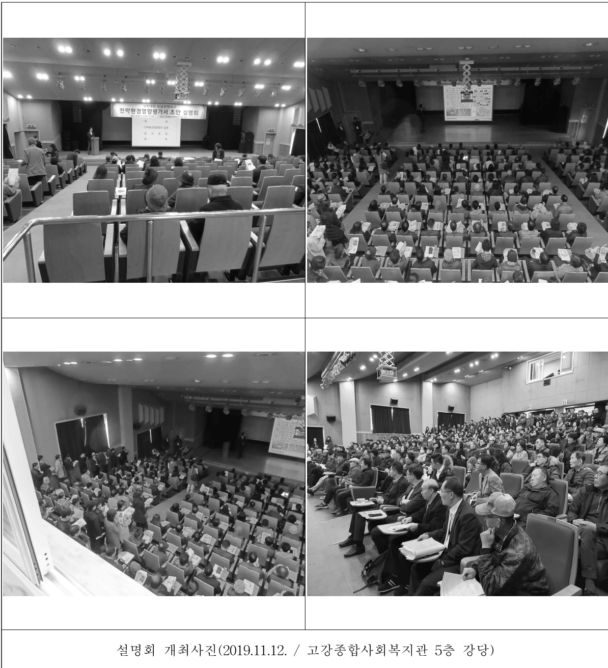
(그림 5) 설명회 개최 사진