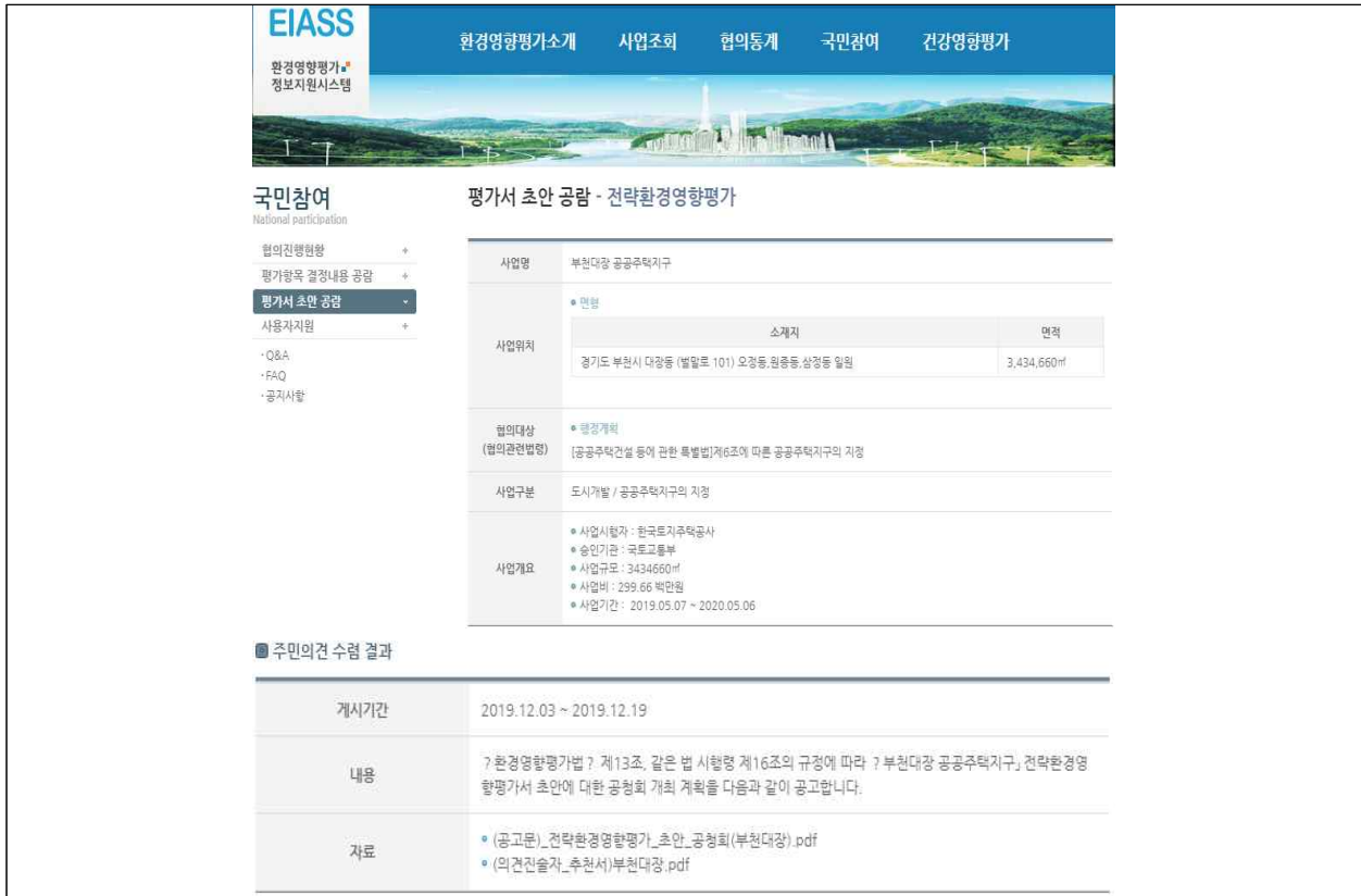
(그림 7) 환경영향평가정보지원시스템( https://eiass.go.kr ) 게재