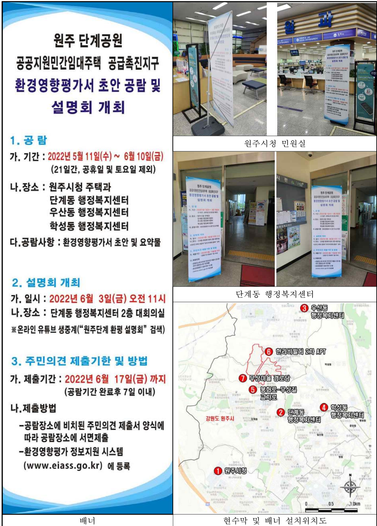
(그림-9) 환경영향평가서 초안 공람 및 설명회 개최 알림 현수막 및 배너(1/2)