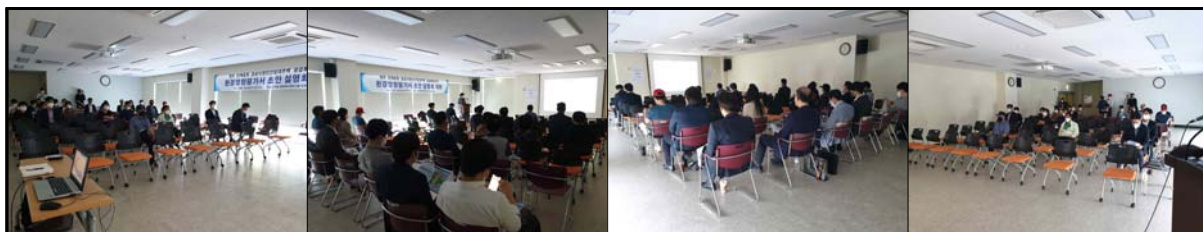
(그림-13) 설명회 개최 사진