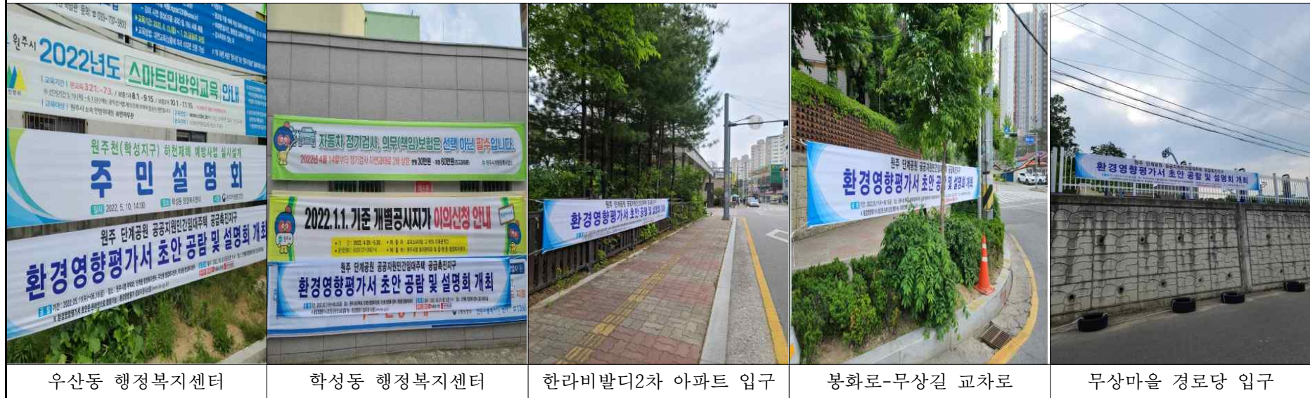
(그림-10) 환경영향평가서 초안 공람 및 설명회 개최 알림 현수막 및 배너(2/2)