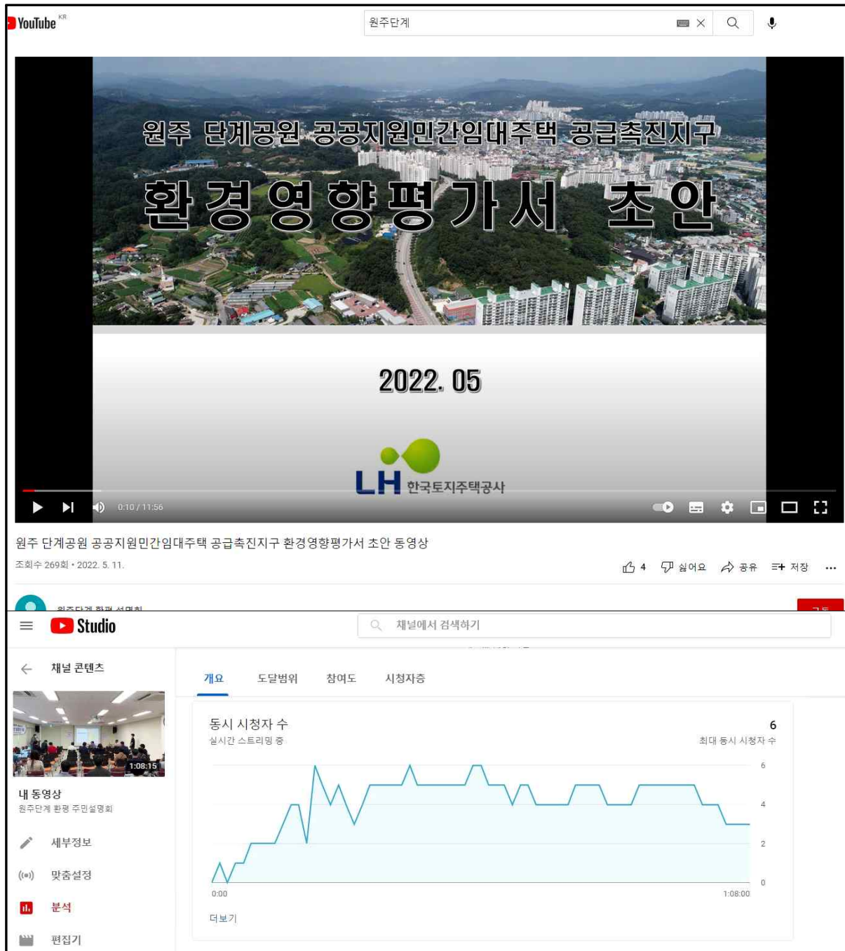
(그림-11) 설명회 동영상 조회 수 및 실시간 생중계 시청자 수