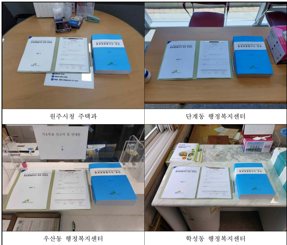
(그림-2) 환경영향평가서 초안 공람 사진