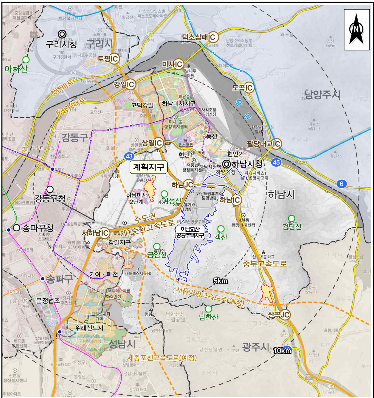
( 그림 1 ) 계획지구 위치도