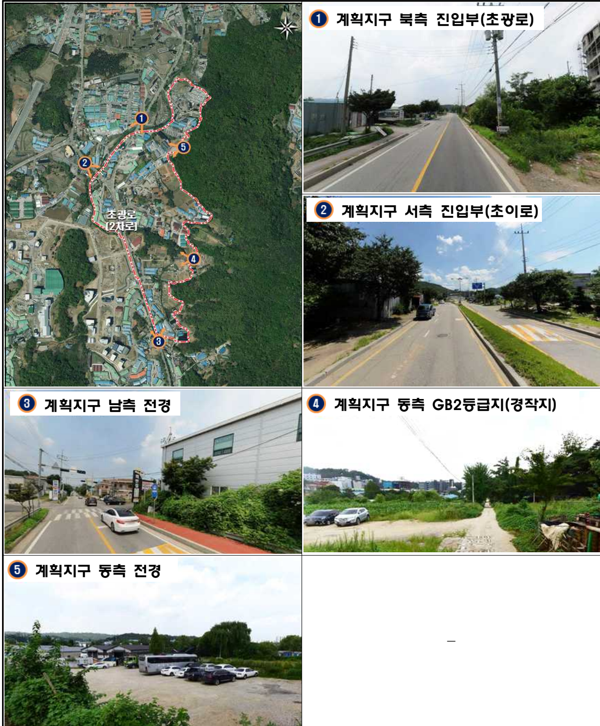
( 그림 2 ) 계획지구 현황사진