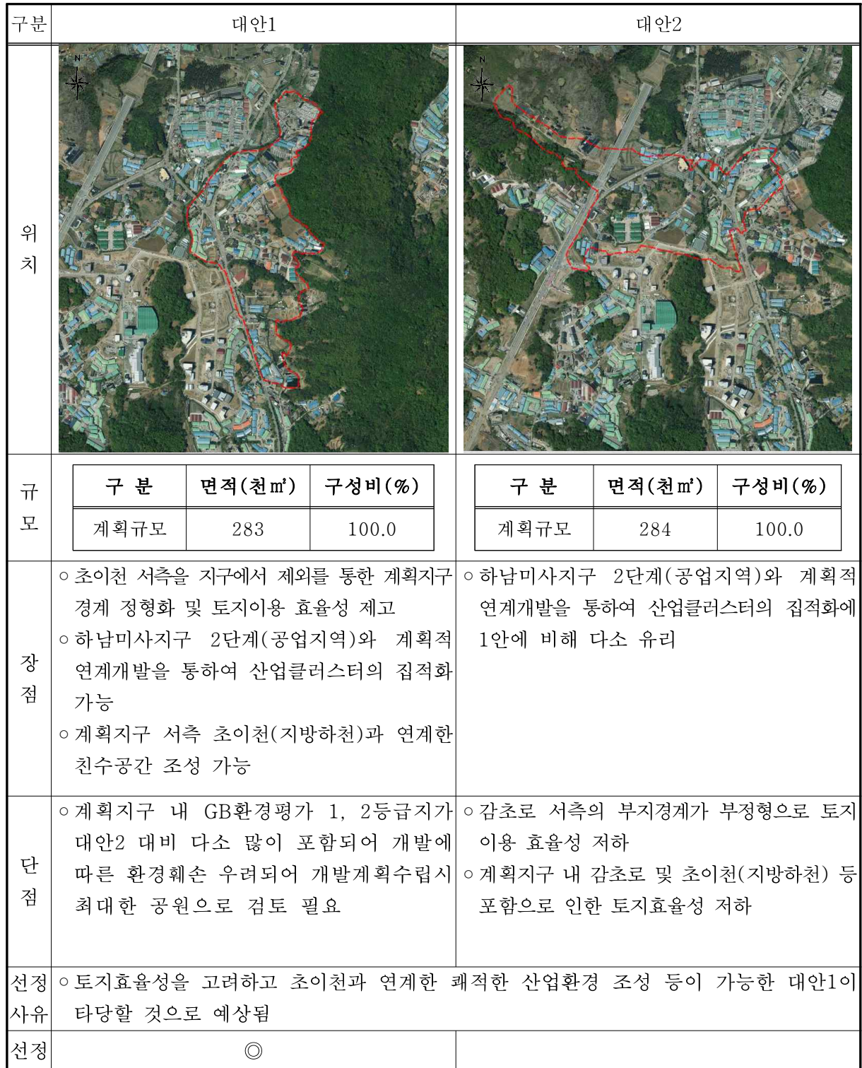
< 표 5 > 입지에 대한 토지이용 구상(안) 및 대안별 비교표