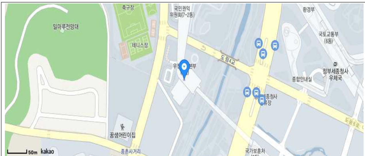
< 정부세종청사 8동(우정사업본부) 약도 >