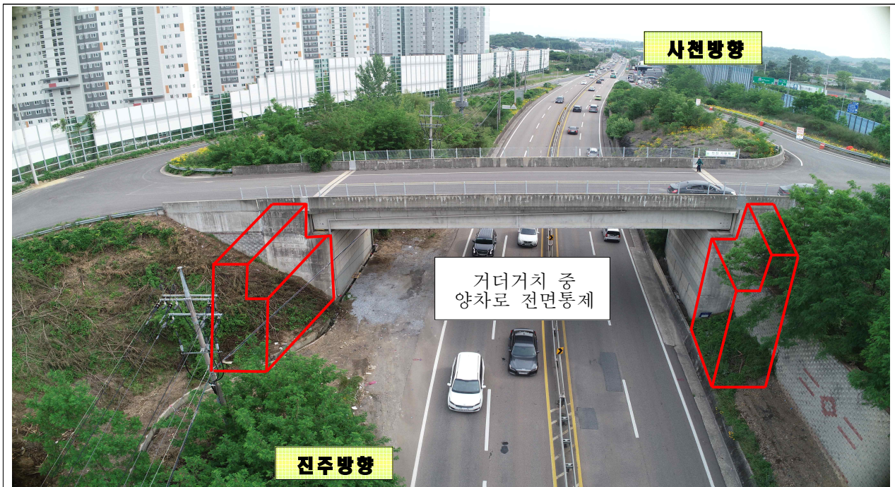
설명 : 예하1육교 국도3호선 사천 방향