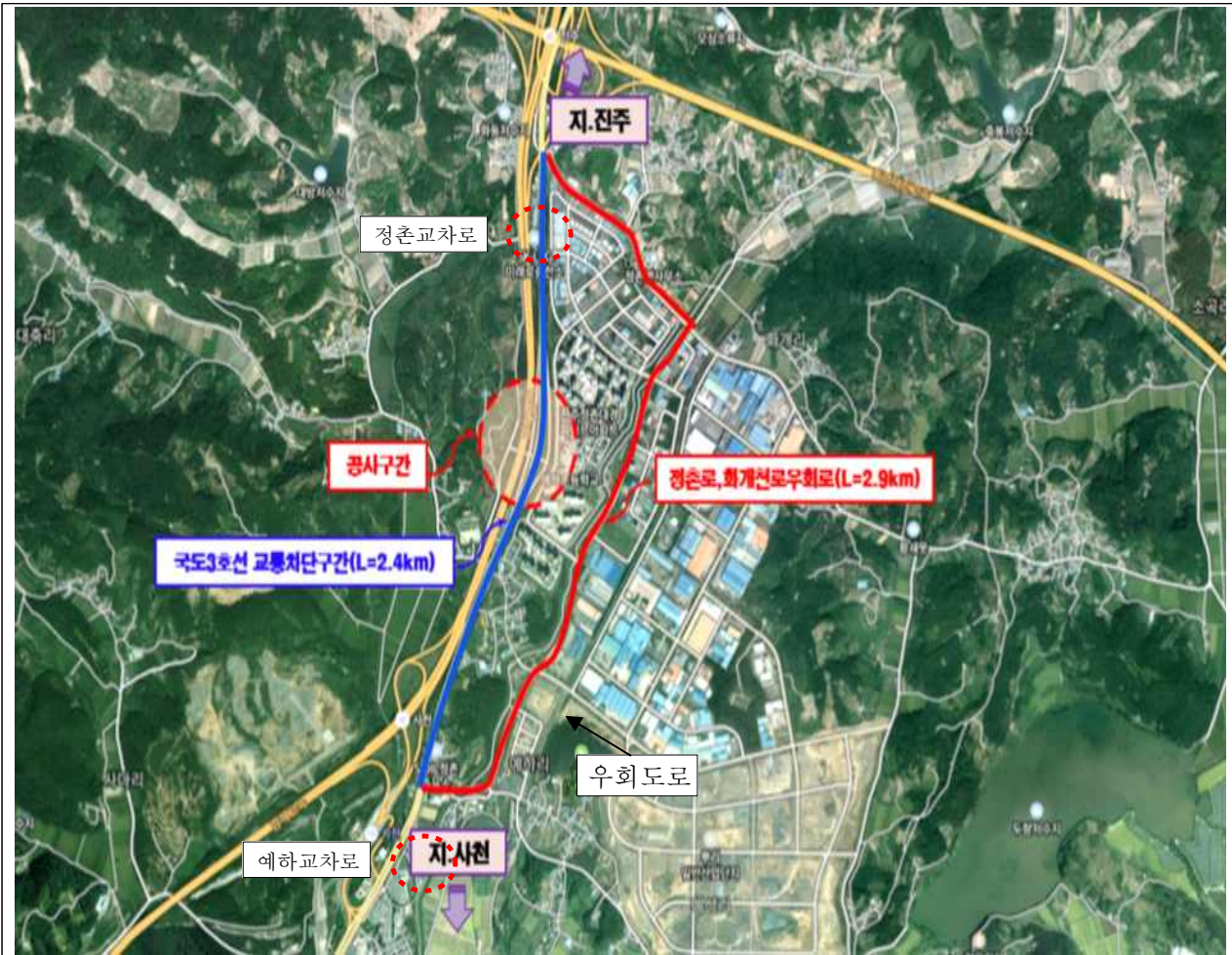
설명 : 예하1육교 교통우회구간 위치도