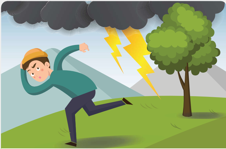
산 위 암벽이나 키 큰 나무 밑은 위험하므로, 낮은 자세로 안전한 곳으로 빨리 대피합니다.