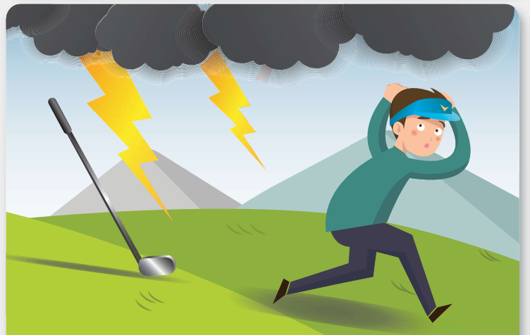
골프, 낚시 등 야외활동 중일 때 장비를 몸에서 떨어뜨리고, 안전한 곳으로 대피합니다.