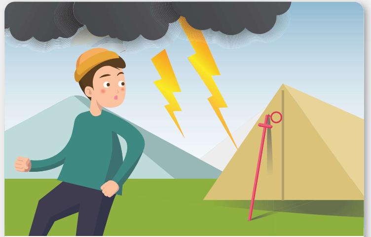
등산용 스틱이나 우산같이 긴 물건은 몸에서 멀리합니다.