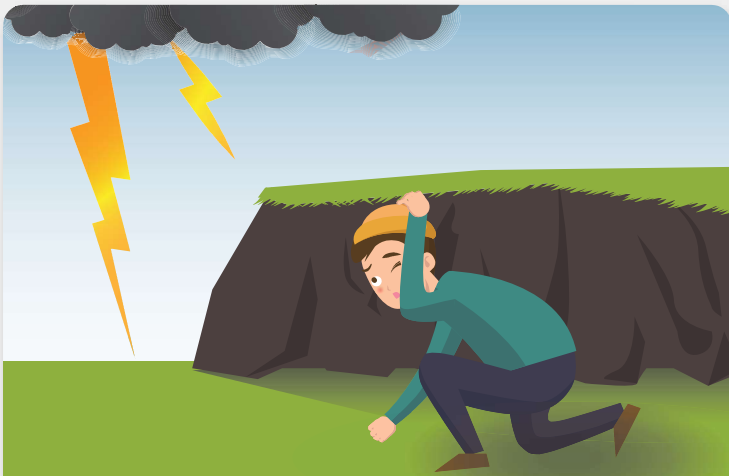
평지에서는 몸을 낮게하고 물기가 없는 움푹 파인 곳으로 대피합니다.