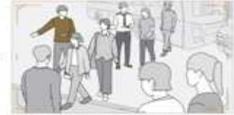
2 | 운전기사를 도와 안전지대로 승객 대피 유도