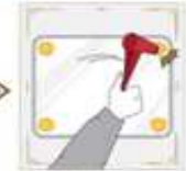
2 | 창문의 가장자리를 가려