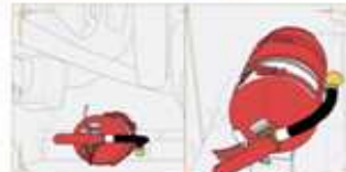
1 | 운전석 뒤, 맨 뒷좌석 뒤에 위치