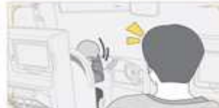
1 | 이상 운행 및 이상 징후 포착