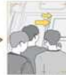
2 | 승강구를 열어 탈출