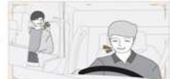
2 | 운전기사에게 통지하여 사고 예방