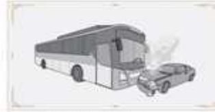
1 | 화재나 교통사고 등 비상상황 발생