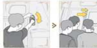
1 | 후측으로 돌아서 사용