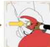
2 | 안전핀 제거