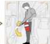
3 | 화재 발생으로 빗자루 불뭉치 분사