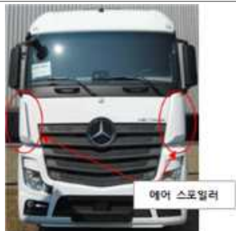
전방 코너 에어스포일러 고정부품