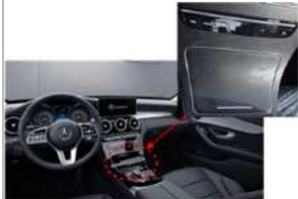
센터 콘솔(중앙 적재함)