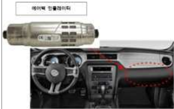
동승자석 에어백 인플레이터