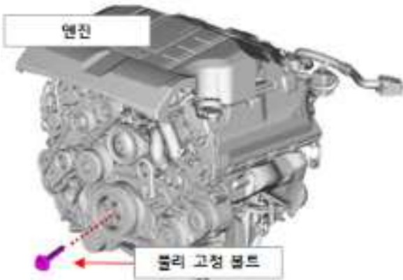
엔진 크랭크축 폴리 고정볼트