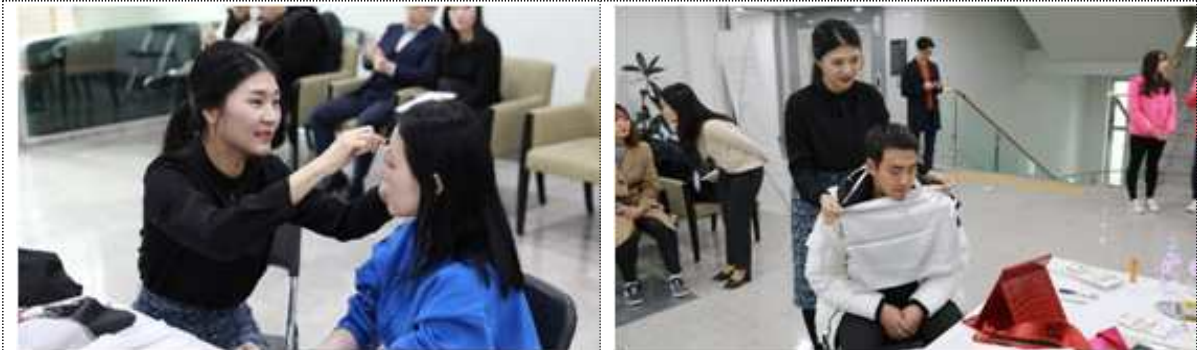
면접 메이크업 컨설팅