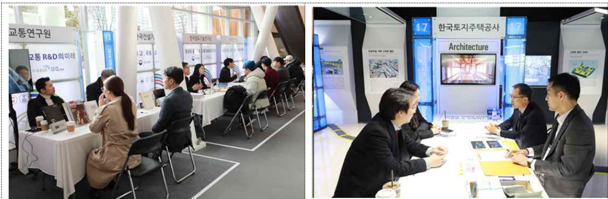
기관별 채용상담 부스