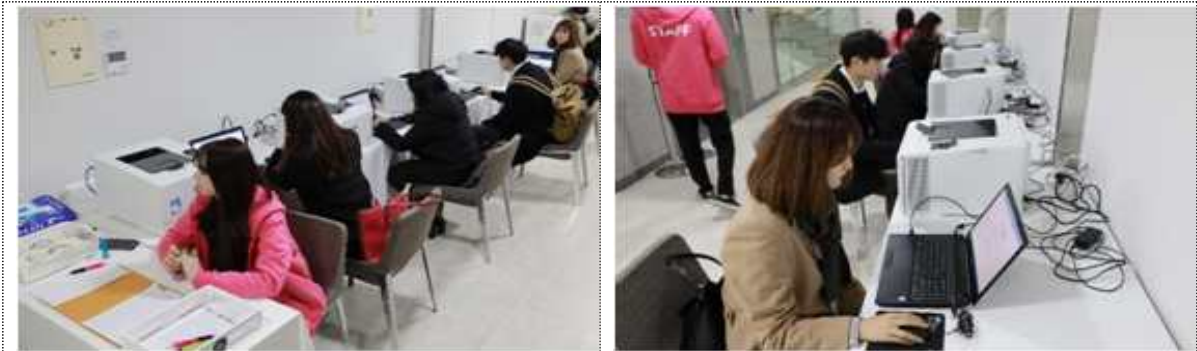
NCS 직업기초능력 진단