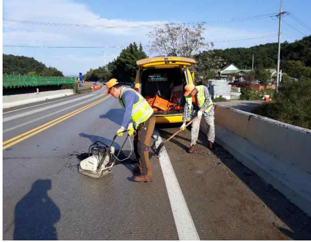
▲ 포트홀 보수