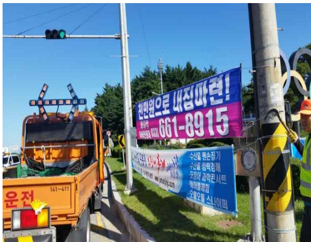
▲ 불법 현수막 철거