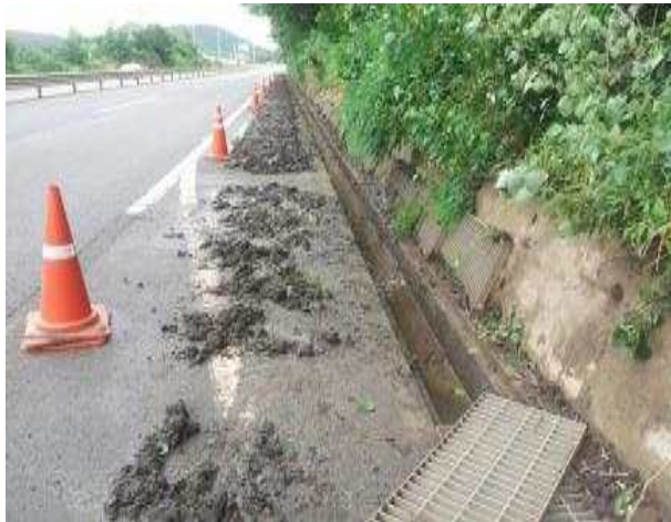
▲ 배수로 청소