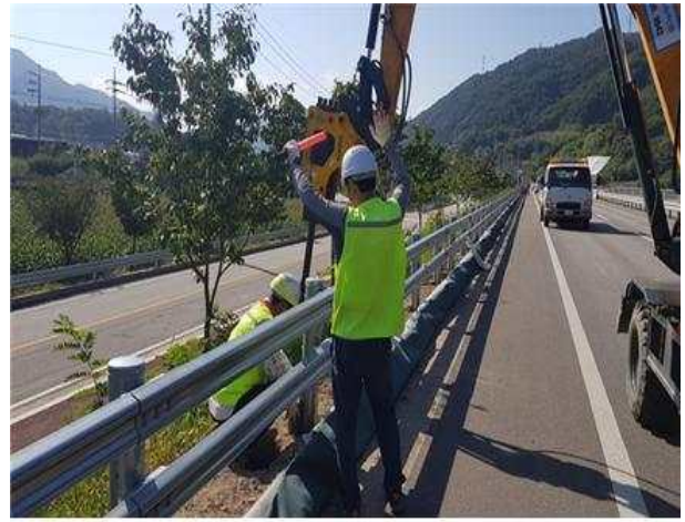
▲ 가드레일 보수