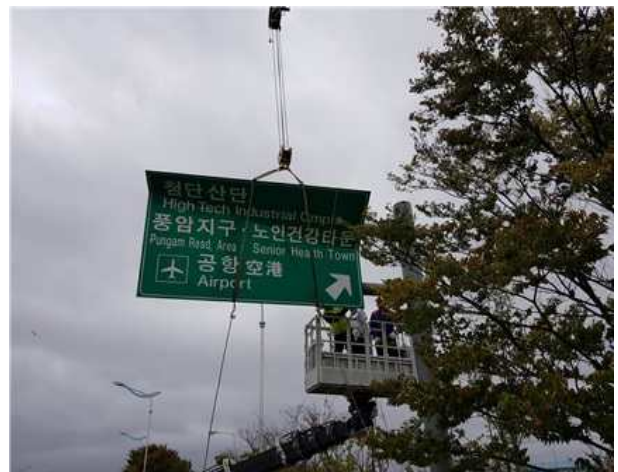
▲ 도로표지 정비