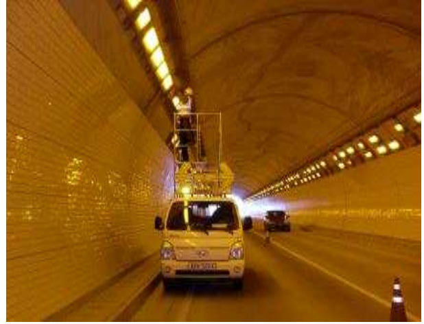
▲ 터널점검 및 조명교체