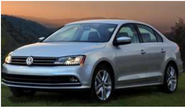
Jetta 2.0 TDI BMT