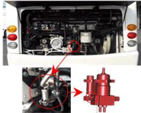
가스 압력 조절기