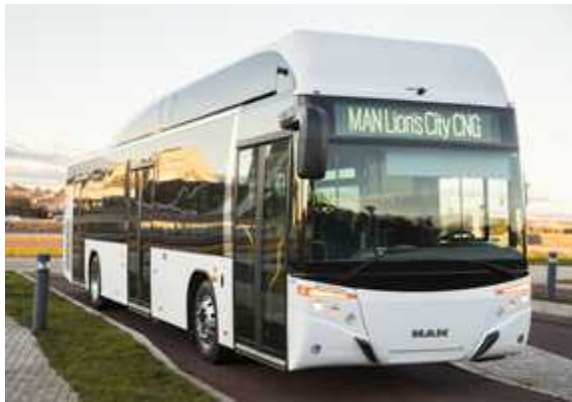
Lion's City CNG