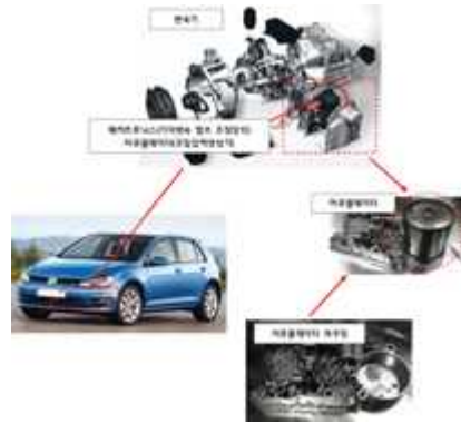
오일 압력 생성기