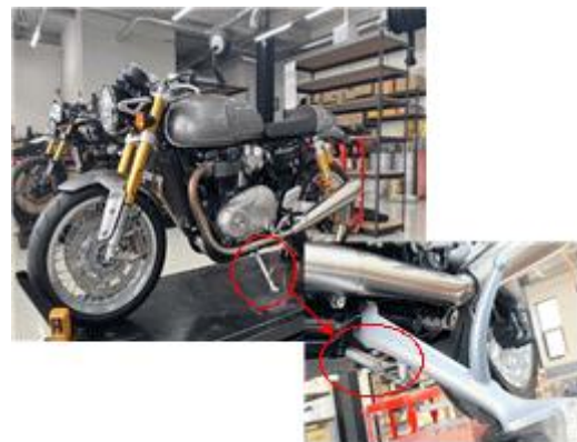
사이드 스탠드 스프링