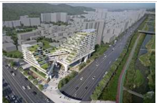
증산 빗물펌프장 복합화