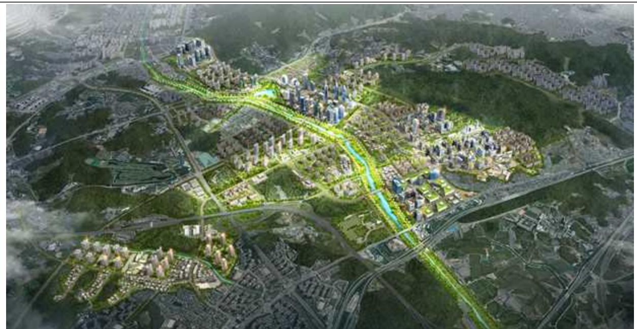
고양 창릉 지구 조감도(지구계획 등에 따라 변경 가능)

* 입지 발표 시 수립한 교통대책 이외 지자체 건의 등을 반영하여 추가 교통대책 검토 중