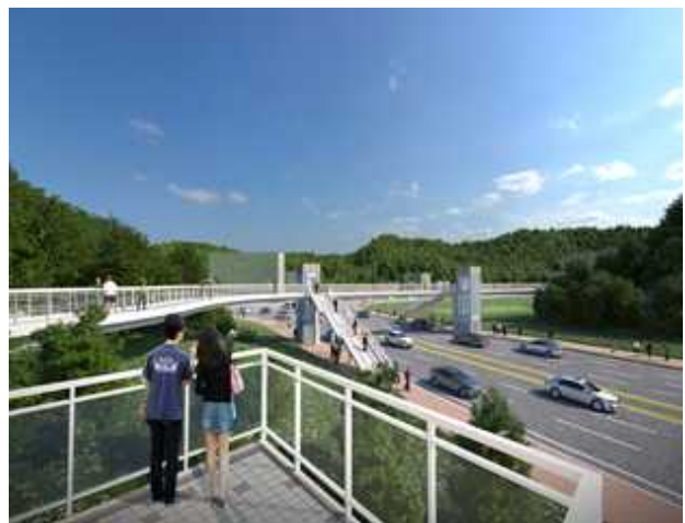
* 참고를 위한 예시도임