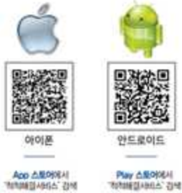
아이폰 App 스토어에서 '적척해결서비스' 검색 안드로이드 Play 스토어에서 '적척해결서비스' 검색