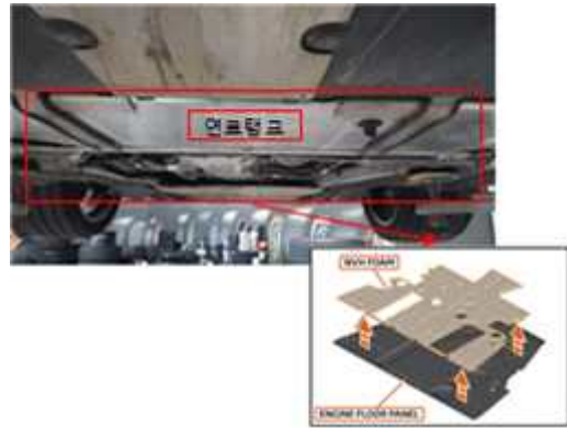
소음·진동 흡수 패드(N.V.H)