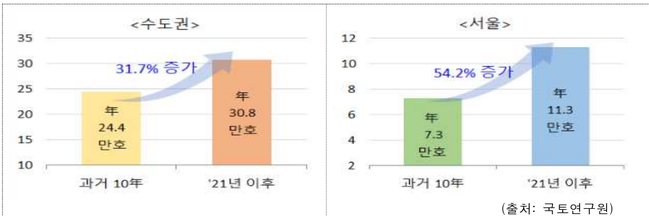
【중장기 입주물량 비교】

→ '21년 2월까지 전국 3.3만, 수도권 2.0만, 서울 0.1만호 분양, 전국기준 최근 10년 이래 최대