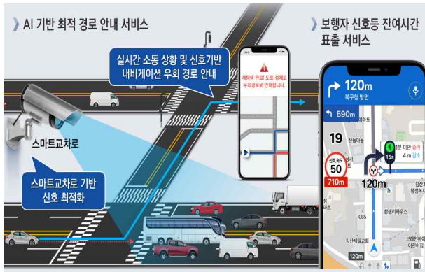
【 대구: AI 기반 도심교통 솔루션 】