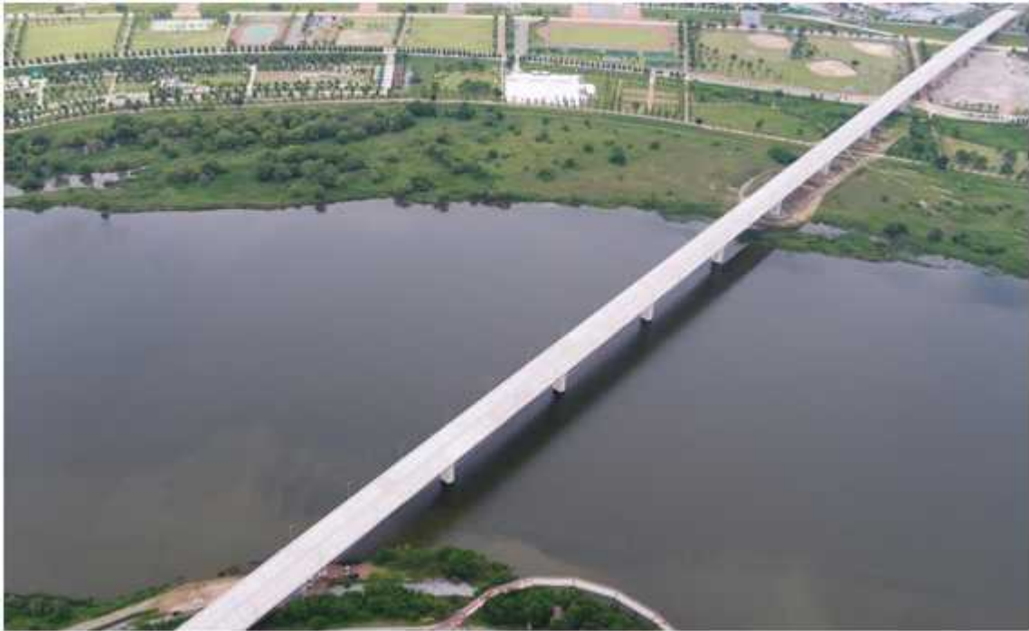
양호대교 전경(PSC BOX 거더교, B=20.9m, L=1,360m)