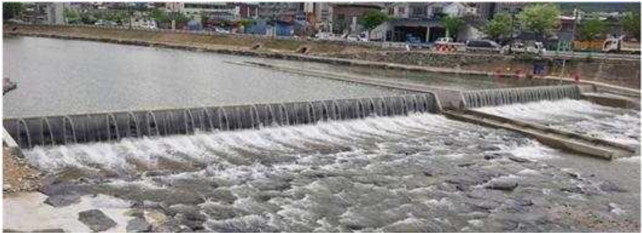
하천보) 하자기간 불분명 ⇒ 본체 10년, 기타시설 5년