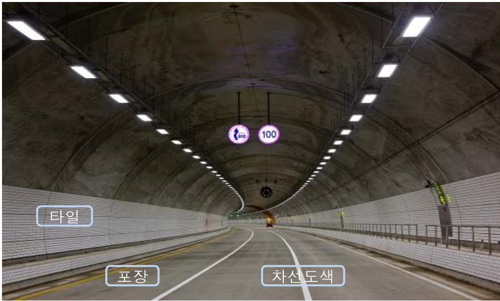
터널) 일괄 10년 적용 ⇒ 포장 2~3년, 차선도색 1년, 타일 1년