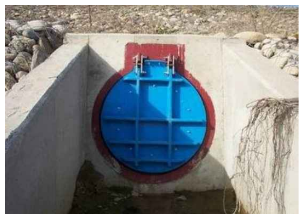
배수통문) 일괄 7년 적용 ⇒ 철근콘크리트 구조부 7년, 관로매설 3년