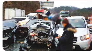
경남 함천 33번 국도사고

47대 추돌 - 사상자 49명 (사망 7명, 중경상 42명/2019. 12. 14)