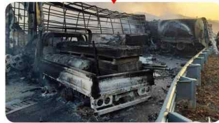
상주 ~ 영천 고속도로사고

47대 추돌 - 사상자 49명 (사망 7명, 중경상 42명/2019. 12. 14)