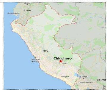
페루 내 위치