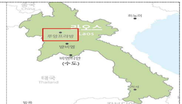
라오스 내 위치