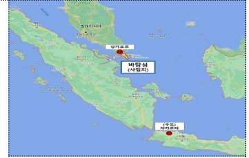
인도네시아 내 위치