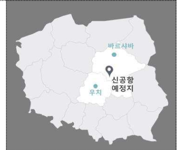
폴란드 내 위치