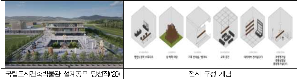
국립도시건축박물관 설계공모 당선작(’20)