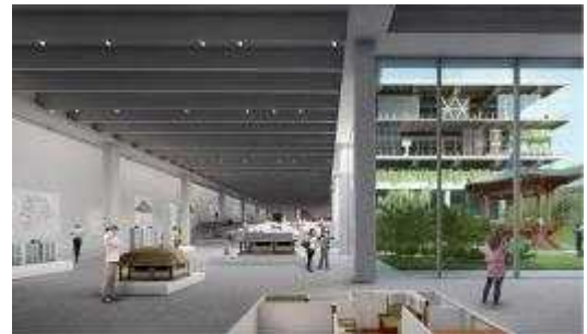
상설 및 기획전(B1~B2F)