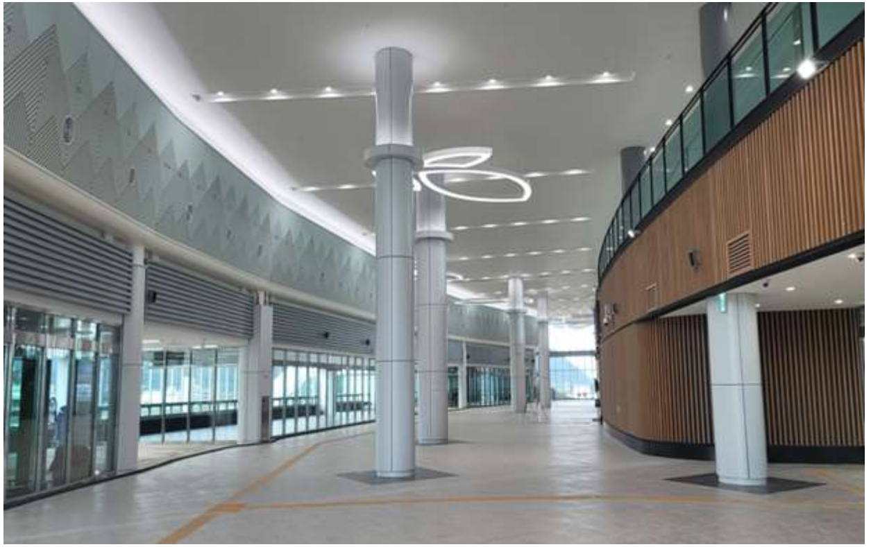
역사 대합실 내부 모습