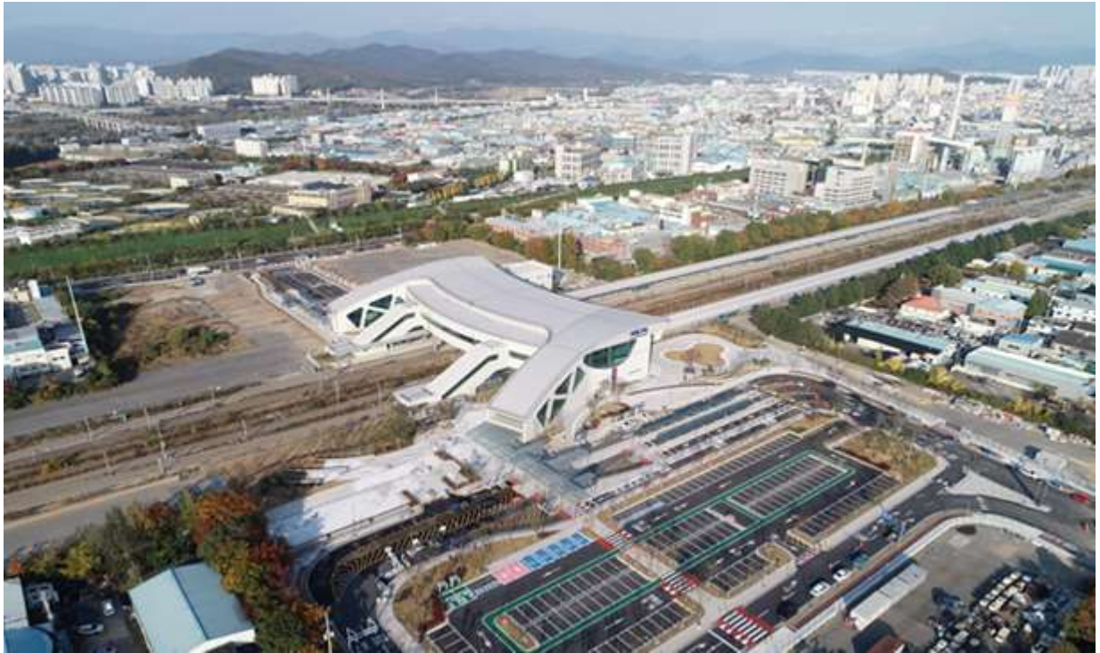
서쪽에서 바라본 서대구역 전경