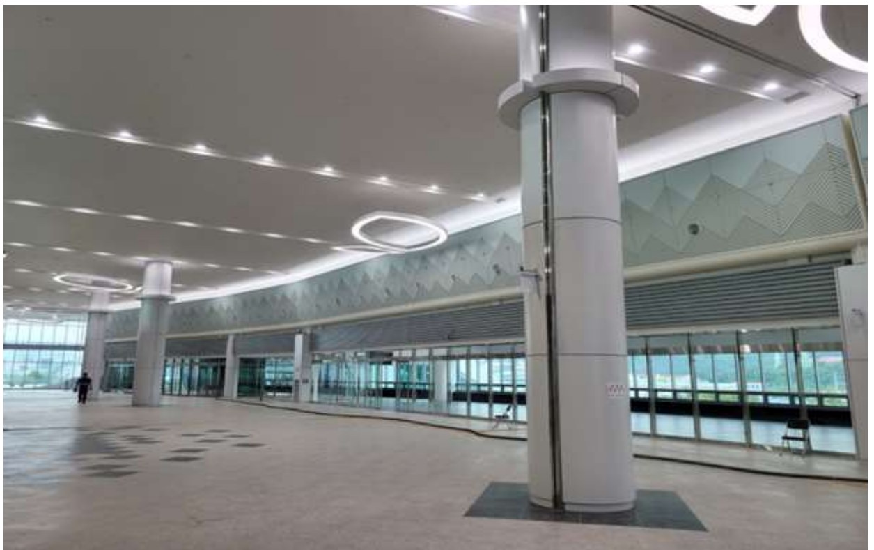
역사 대합실 내부 모습