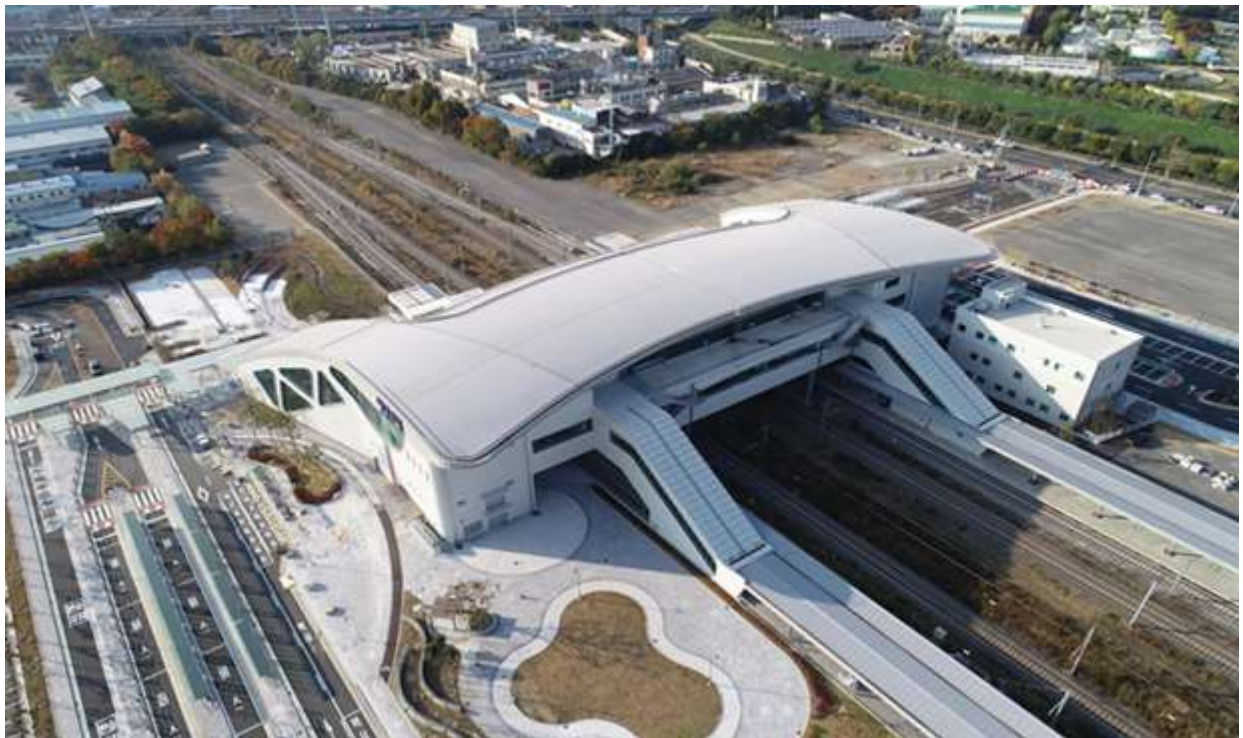
동쪽에서 바라본 서대구역 전경