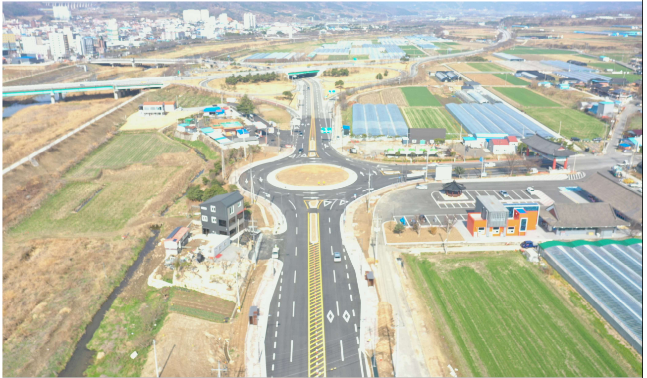
국도 18호선 전경(냉천회전교차로)