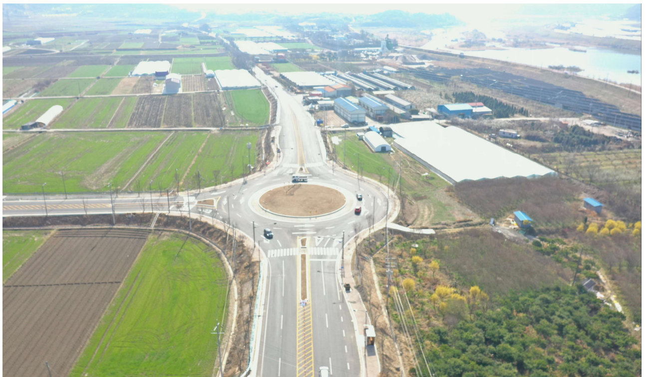
국도 18호선 전경(광평회전교차로)