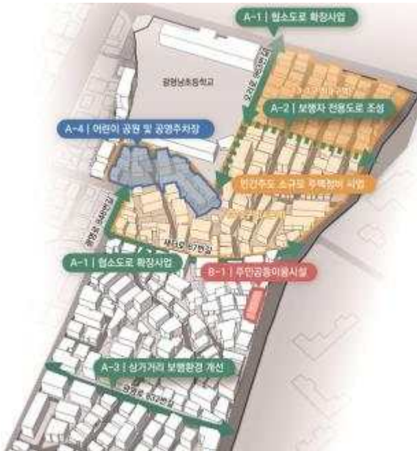
<광명시 광명7동 일원>