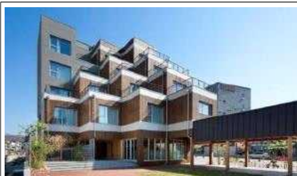
❶ 공동체 플랫폼(춘향골 나무향기 활력센터)