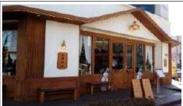
❷ 목재 테마 상가 정비