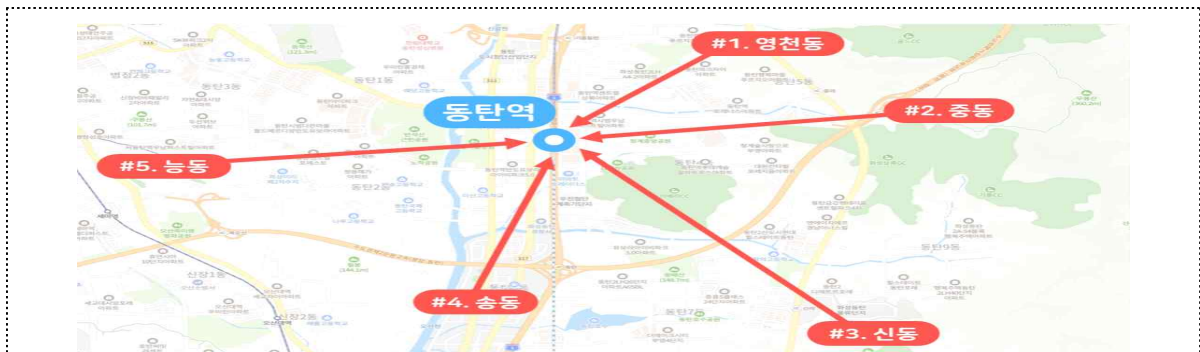
「수도권 남부지역 교통편의 제고방안」 중 동탄권 5개 노선 신설 방안