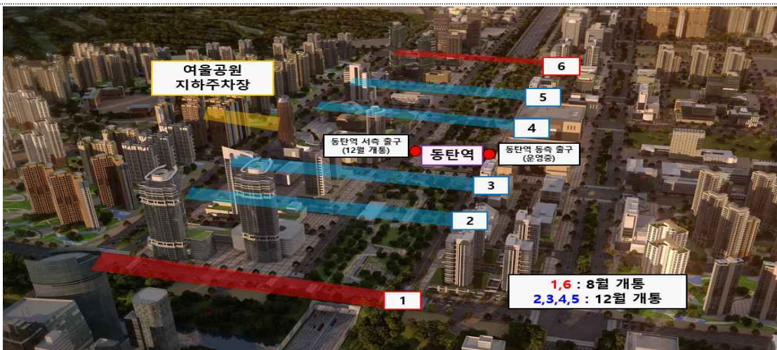
동탄역 동서연결도로 및 여울공원 지하주차장 위치도