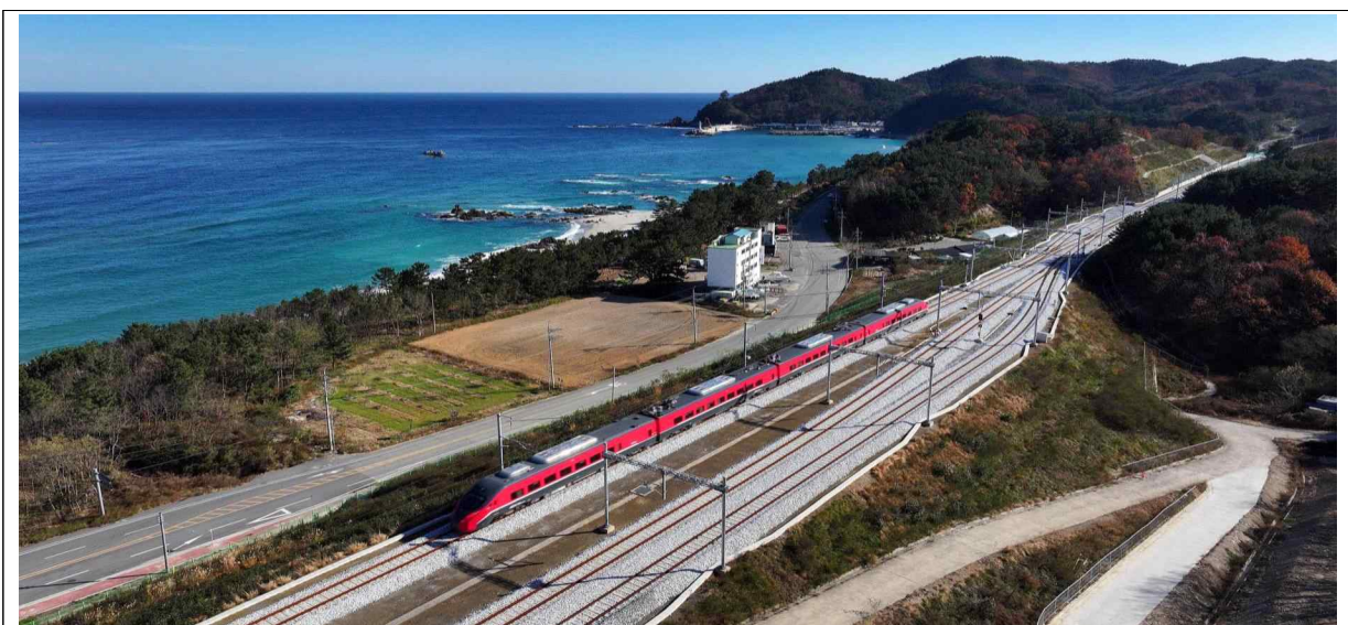
△근덕역(삼척시)을 지나는 ITX-마음