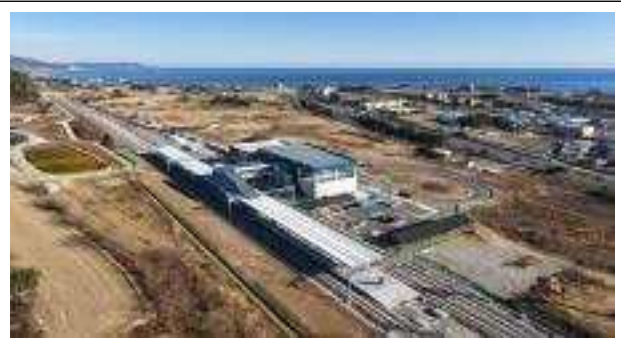
△ 고래불역(영덕군) 전경

○ 특히, 내년에 포항, 경주, 영덕, 울진 일원의 동해안 국가지질공원* (2693.69km 2 )이 유네스코 세계지질공원으로 지정되면, 동해선 열차로 떠나는 동해안 지오투어리즘(지질관광)도 확산될 것으로 전망된다.