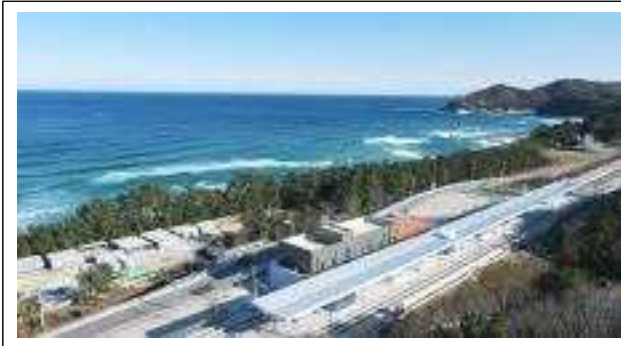
△ 근덕역(삼척시) 전경